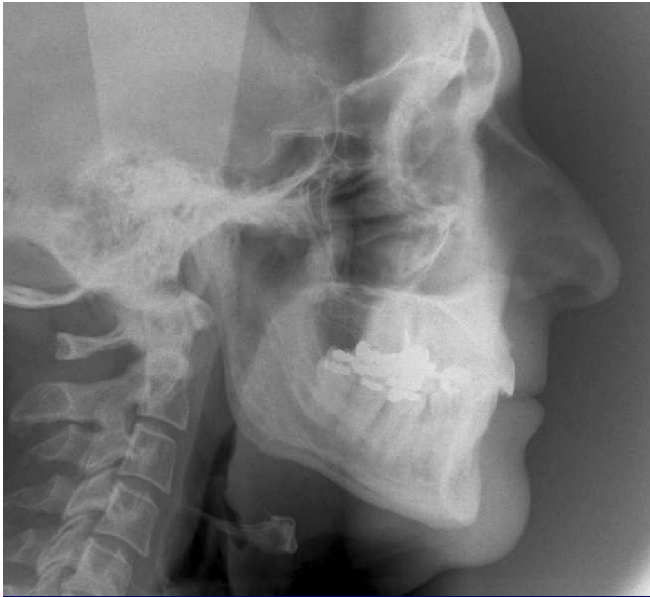
Sans / Without